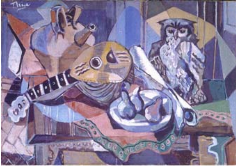
Ende 50er Jahre