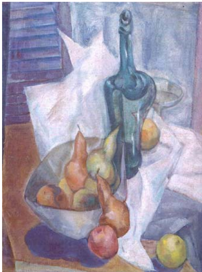
Stilleben, Entstehungsdatum unbekannt