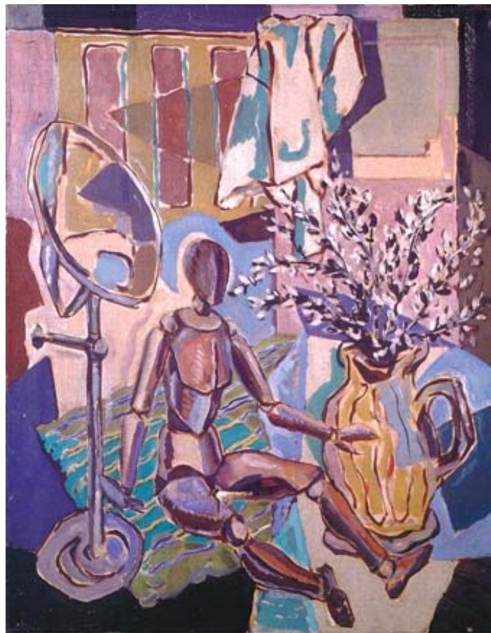
Ende 50er Jahre