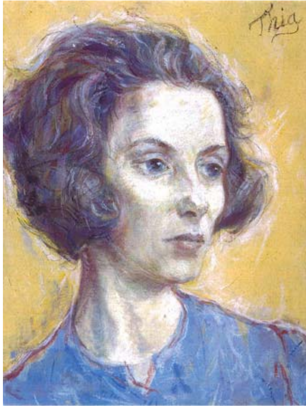
Frauenportrait, Ende 60er Jahre