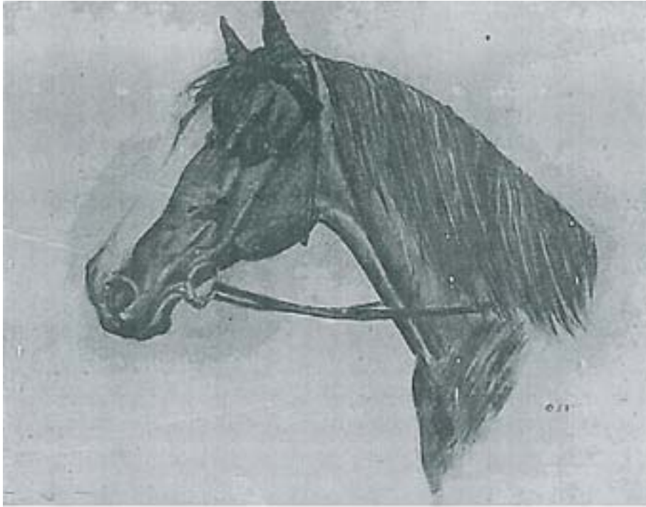
Pferdekopf, ca. 1943 (vor Cynthias Begegnung mit Th.Mann)