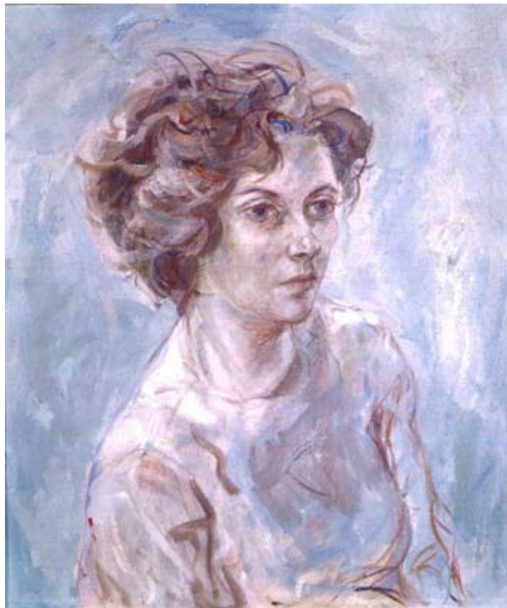
Frauenportrait, Ende 60er Jahre